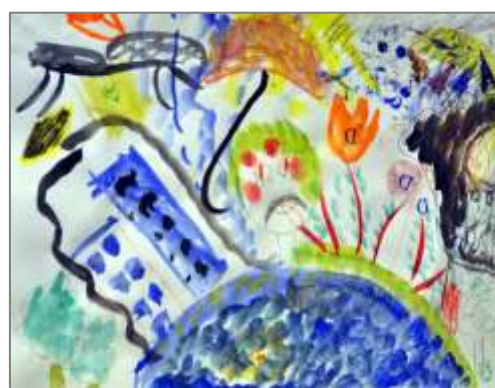
Beispiel aus dem Seminar: Arbeitsstation (li.) und Ergebnis (re.) zu „Kritz & Klecks“