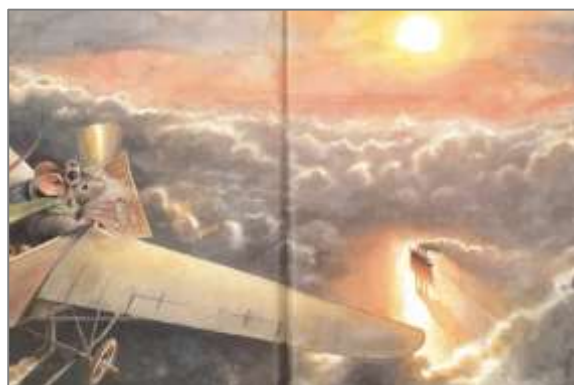
Abbildungen aus „Lindbergh“: Erstes und letzte Seite der bearbeiteten Bildsequenz