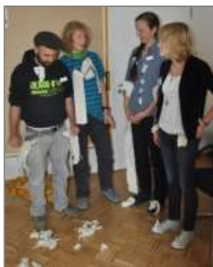
Beispiel aus dem Seminar: Arbeitsergebnisse: Ordnung (li.) und Chaos (re.)